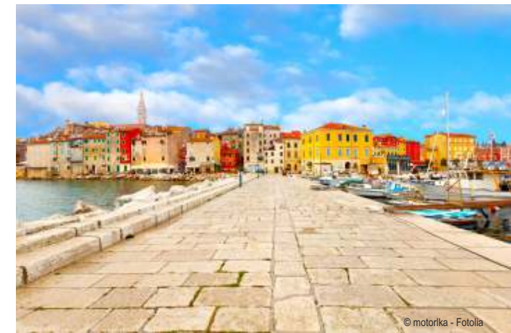
Hafen von Porec, Kroatien