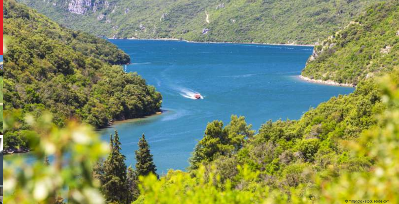
Limski Fjord, Istrien